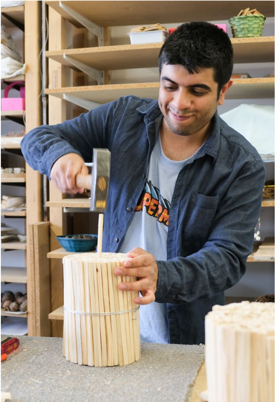
Herstellung der Fiametti-Bunde im Atelier