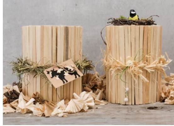
Stoffmasken nähen & dekorierte Fiametti