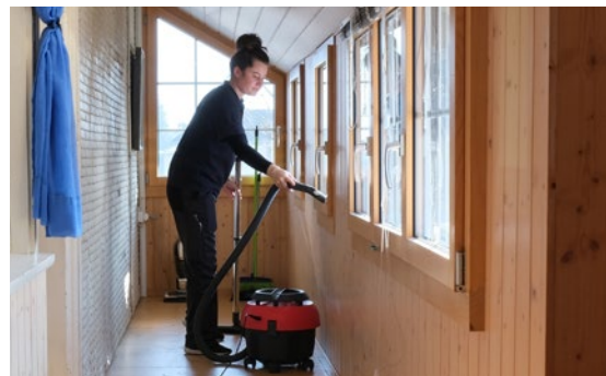
Kundenauftrag zur Grobreinigung einer Wohnung in Unterseen.