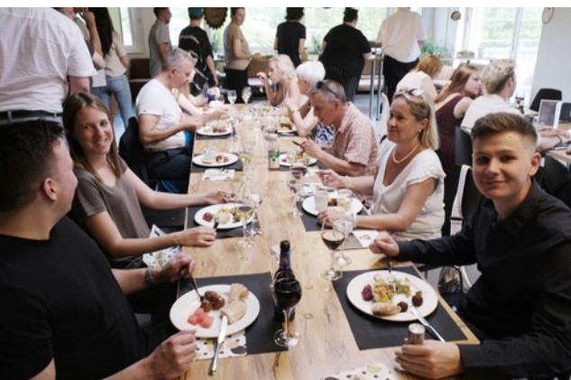
2024 an der Lehrabschlussfeier in der SEEBURG.

Im dritten Lehrjahr durfte ich ein Praktikum bei BERNMOBIL absolvieren – das war ein echter Glücksfall. Insgesamt verbrachte ich dort über fünf Monate. Nach der Abschlussprüfung durfte ich sogar nochmals zurück und meine Ausbildung bei ihnen abschliessen. Die Atmosphäre war toll, das Team hat mich sofort aufgenommen. Ich war überrascht, wie offen ich selber war. Ich versteckte mich nicht, war präsent und kam gut mit allen aus. Es war eine Umgebung, in der ich aufblühte.